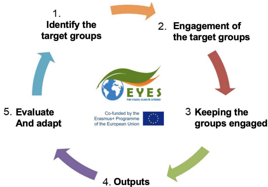
Фиг. 1: Фази на методологията EYES.

Методологията EYES използва подхода „активна лаборатория“ като структура за участие на младите хора, но могат да бъдат разгледани много други възможности за включването им, които могат по-добре да се адаптират към ресурсите и контекста на различните общини. Във всеки случай това означава, че общините създават среда с отворени иновации, адаптирана към тяхната собствена реалност, но базирана на съвместно създаване с целевите групи; по този начин младите хора могат да предоставят информация, съвети или препоръки относно енергийното и климатично планиране. В този смисъл всяка фаза на процеса може да се различава от един град до друг, за да се адаптира към съществуващите възможности и бариери във всеки отделен случай. За по-нататъшно развитие на фиг. 1, стъпките в методологията на „активна лаборатория“ на EYES са следните: